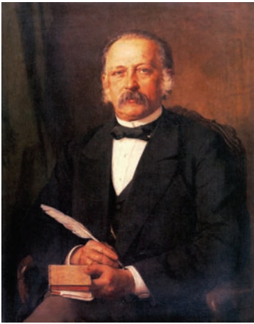
Theodor Fontane, 1883 (Gemälde von Carl Breitbach)

Gottes Gerechtigkeit hat nichts mit dem zu tun, was Menschen unter Gerechtigkeit verstehen.