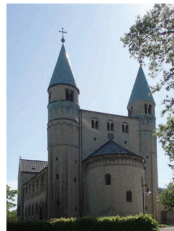
Westfront der Stiftskirche St. Cyriakus

Der EAK und die Landeskirche Anhalt wollen ihren Meinungsaustausch regelmäßig fortsetzen.