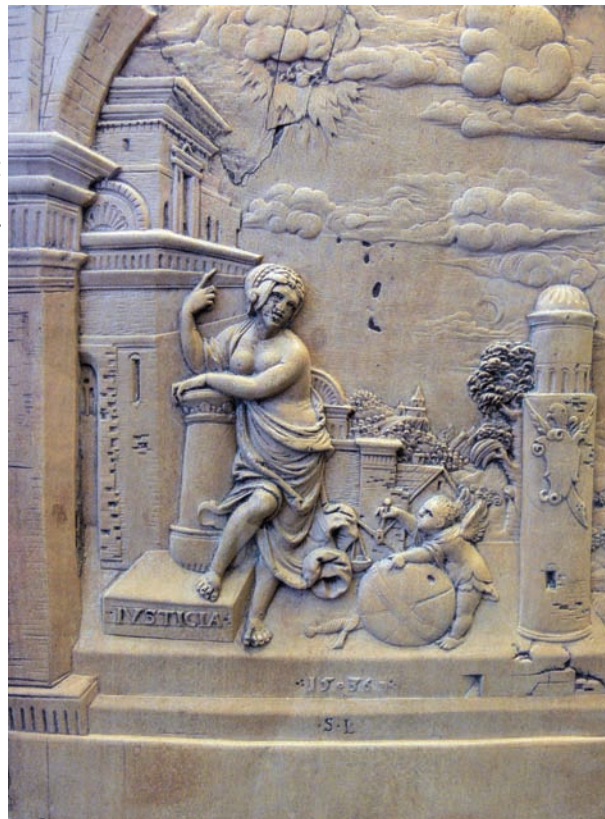
Sebastian Loscher: Irdische und göttliche Gerechtigkeit (1536)

Wer ist der Größte unter uns? - So stritten die Jünger Jesu damals. (Lukas 9, 46-50) „Es entstand aber unter ihnen eine Überlegung, wer wohl der Größte unter ihnen